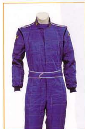
KFTU1101 BLU BLUE