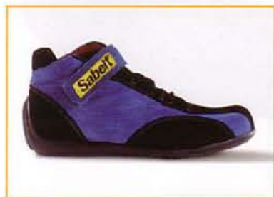
K131312 BLU-NERO BLUE-BLACK

Mid shoes dedicated to kids. Suede vamp. Velcro fastening for secure fit. Pilot design sole in TR syntetic mixture. Sizes from 30 to 34.