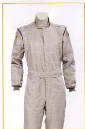
KFTU5501 GRIGIO GREY