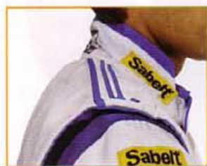
Giro manica in maglina. Floating sleeves.