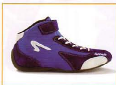
K131330 BLU ROYAL/ROYAL BLUE