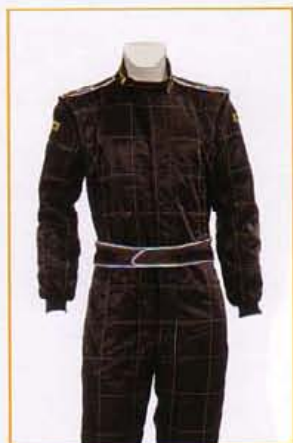
KFTU2201 NERO BLACK