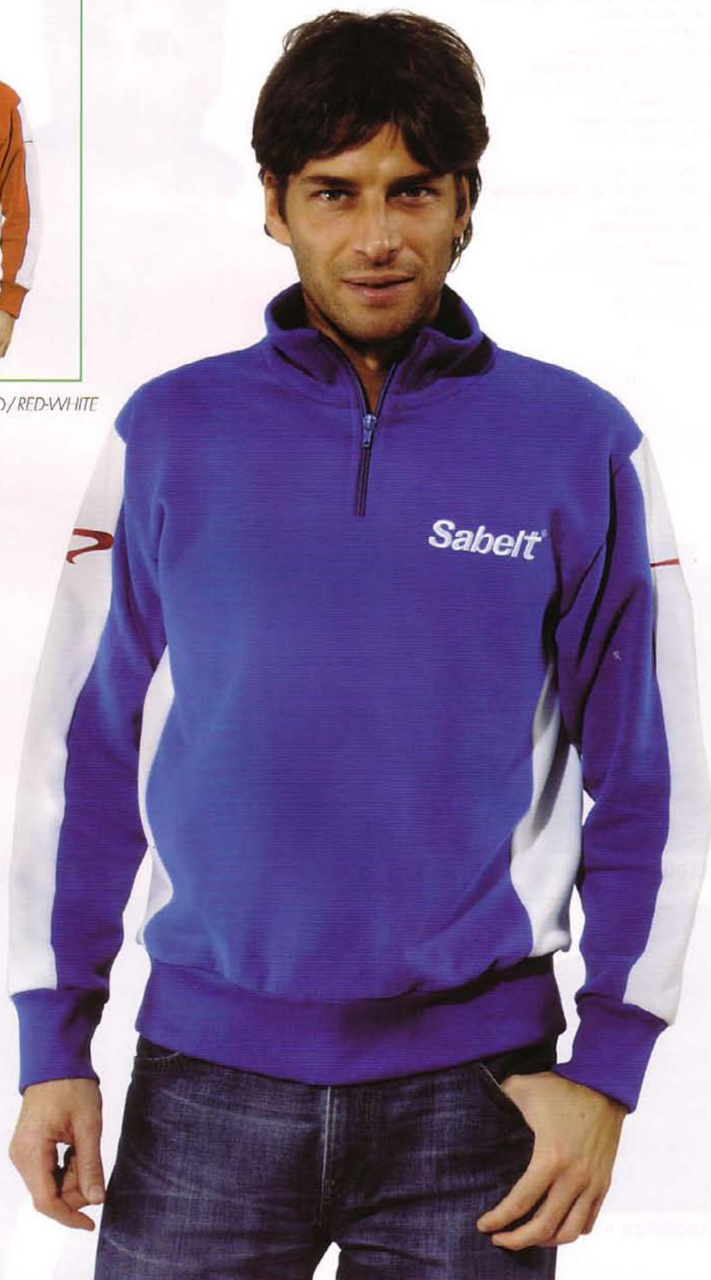
Z60FESAB16 BLU ROYAL-BIANCO ROYAL BLUE-WHITE

Felpa Sabelt realizzata in tessuto 100% cotone smerigliato. Morbido e confortevole adatto ad ogni tipo di stagione. Taglie: da XS a XXL.