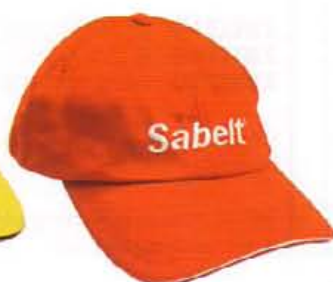
Z600020 NERO / BLACK Z600040 ROSSO / RED Z600080 GIALLO / YELLOW

Cappellino in cotone. Strong cotton fabric cap.