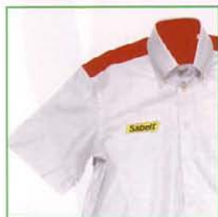
Z600CAM400 BIANCO-ROSSO / WHITE-RED