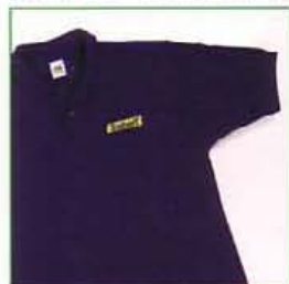
Z60P10 BLU NAVY/NAVY BLUE