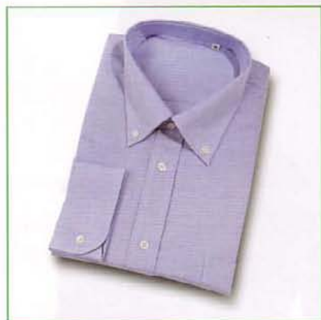
Z60C430 AZZURRO/PALE BLUE

Top quality long sleeve shirt. Features a breast pocket. Sabelt embroidery. Sizes from S to XXL.