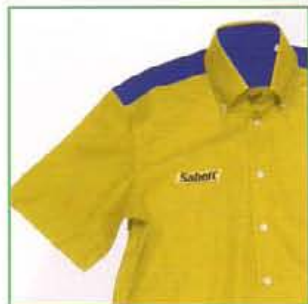
Z600CAM710 GIALLO-BLU / YELLOW-BLUE