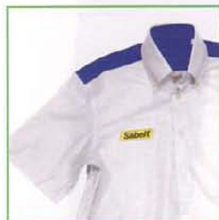
Z600CAM410 BIANCO-BLU / WHITE-BLUE

Possibilità di avere la camicia team in due colori a vostra scelta. 100% cotone, taglie dalla S alla XXL. Contatta il nostro servizio clienti per maggiori informazioni.