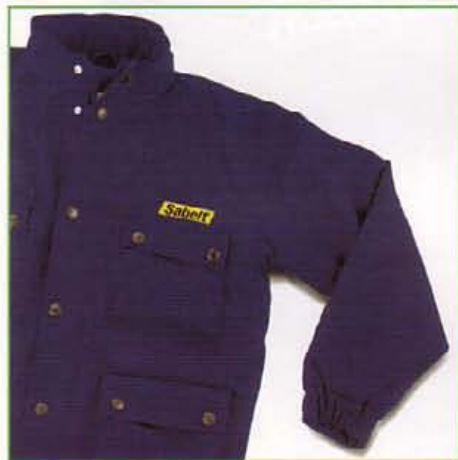
Z60GIT10 BLU NAVY/NAVY BLUE