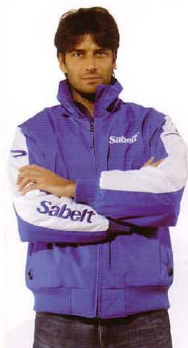
Z60GISAB16 BLU ROYAL-BIANCO ROYAL BLUE-WHITE