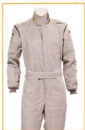
KFTU5501 GRIGIO GREY