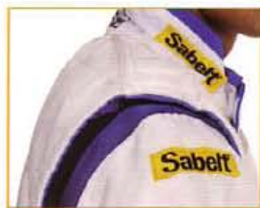
Giro manica in magliana. Floating sleeves.