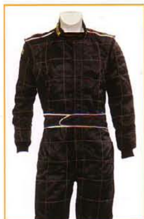
KFTU2201 NERO BLACK