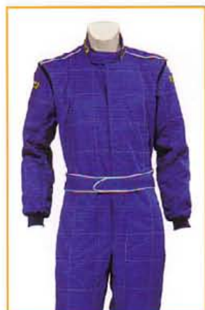
KFTU1101 BLU BLUE